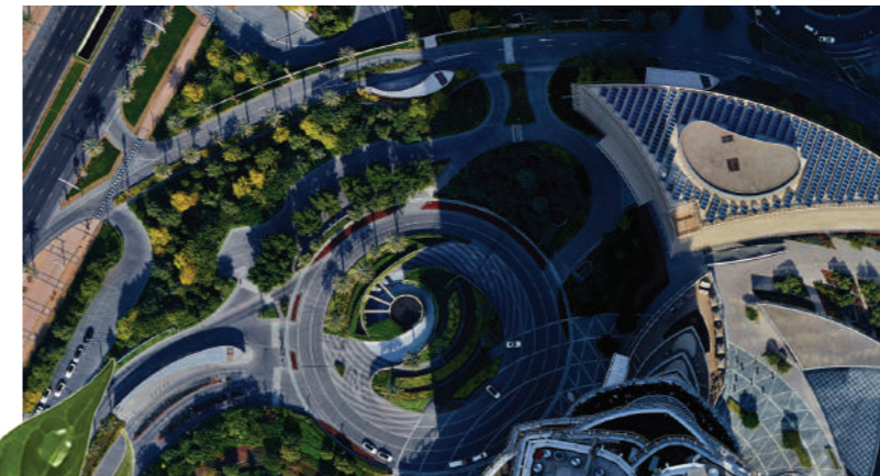
BURJ KHALIFA, DUBAI

Sono disponibili sistemi con serbatoi comprendenti due scambiatori di calore. Progetti più grandi sono progettati su