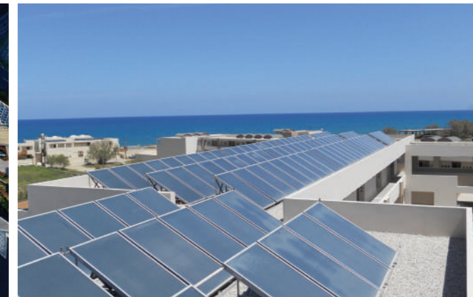
KOLYMPARI BEACH HOTEL, GRECIA