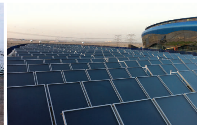
HAMDAN SPORTS COMPLEX, DUBAI